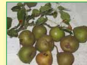
Spitze Gelbbraune (Arbeitsstiel)